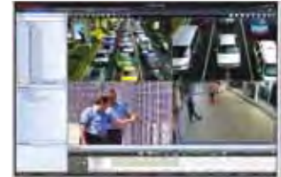
MAXPRO VMS Client Viewer 2x2