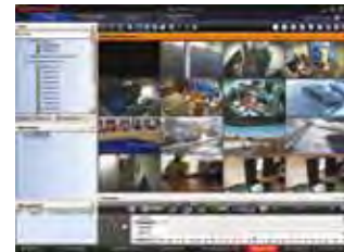
MAXPRO VMS Client Viewer 4x4