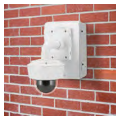
AXIS T98A18-VE Überwachungsschrank