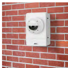
AXIS T98A17-VE Überwachungsschrank