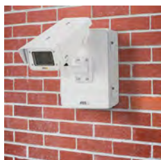
AXIS T98A16-VE Überwachungsschrank