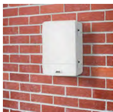
AXIS T98A15-VE Überwachungsschrank