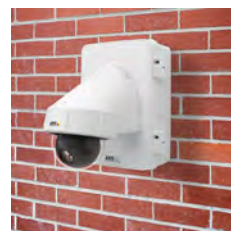
AXIS T98A19-VE Überwachungsschrank