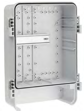
Links: Leichter Überwachungsschrank aus PolycarbonatMitte: Scharnieranschlag bei 105°Rechts: Vormontierte DIN-Profileschienen